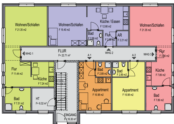
GRUNDRISS SOZIALES WOHNEN

Sie möchten wissen ob und wie eine NUSSER Unterkunft in Ihre Bauplanungen passt? Melden Sie sich bei uns – wir helfen Ihnen, die für Ihren Bedarf optimale Lösung zu finden.