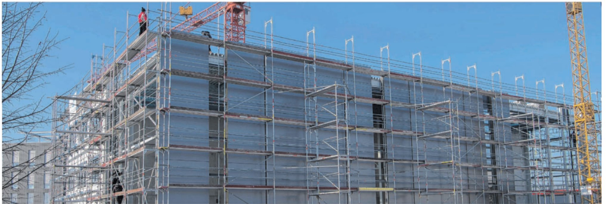
Realisiert werden der neue 1800 Quadratmeter große dreistöckige Bürokomplex für 120 Mitarbeiter und die 550 Quadratmeter große Produktionshalle innerhalb eines halben Jahres von Nusser-Systembau als Generalunternehmer und Vermieter des Neubaus in hochwertiger und energiesparender Holzrahmenbauweise.

Realisiert werden der neue 1800 Quadratmeter große dreistöckige Bürokomplex für 120 Mitarbeiter und die 550 Quadratmeter große Produktionshalle innerhalb eines halben Jahres von Nusser-Systembau als Generalunternehmer und Vermieter des Neubaus in hochwertiger und energiesparender Holzrahmenbauweise. Hier werden nun Kundenprojekte sowie Forschungs- und Entwicklungsprojekte für die Flugzeugindustrie durchgeführt